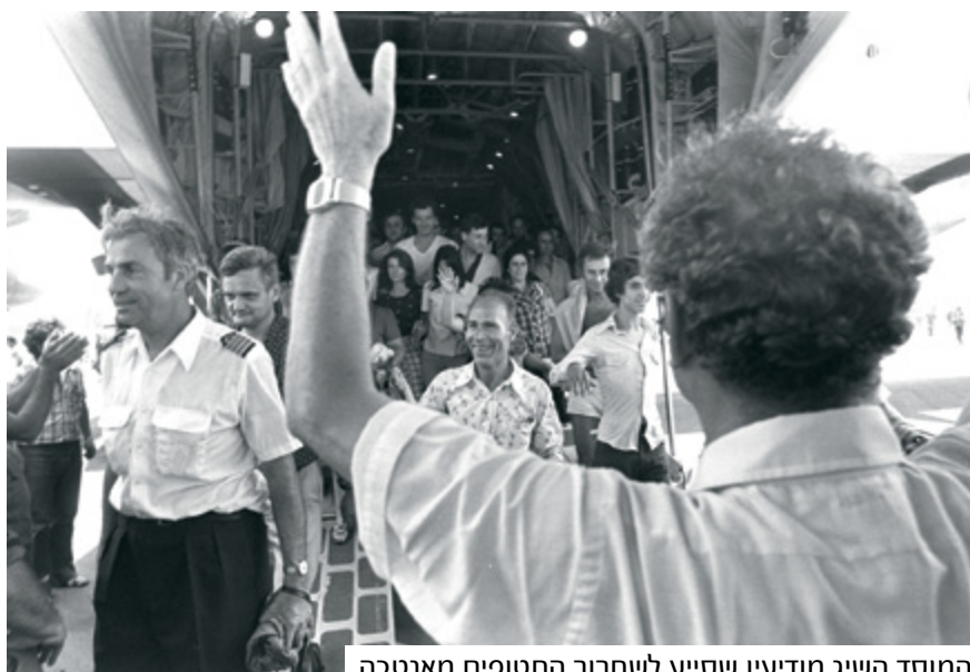
המוסד השיג מודיעין שסייע לשחרור החטופים מאנטבה