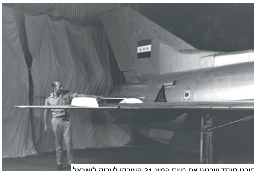
סוכני מוסד שכנעו את טייס המיג 21 העירקי לערוק לישראל