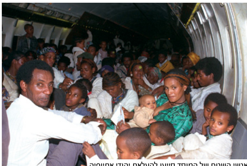
אנשי השטח של המוסד סייעו להעלאת יהודי אתיופיה

מכיוון שמאז שנות ה-60 של המאה הקודמת ועד היום מקפיד המוסד להימנע מניהול קשר ממוסד עם אמצעי התקשורת, ובכך פועל לשמירת העמימות של הארגון, הדבר מעצים עוד יותר את ההילה האופקית אותו. עם זאת, מעניין לראות שגם כאשר נחשפות פעולות