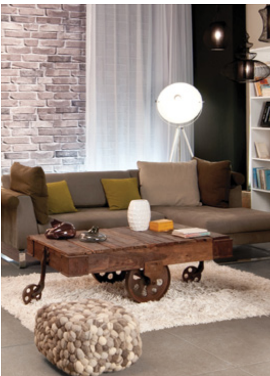
חדר מתוך קמפיין טלוויזיה, מוצף באריחי הקולקציה החדשה CONCRETE המיוצרים בטכנולוגיה הדיגיטלית.

בתחום עיצוב הבית בישראל קיימות פירמות ומותגים רבים, כמו גם משווקים קטנים המתחרים בחברה ובמוצריה. בתחום מוצרי הקרמיקה קיימת תחרות חריפה עוד יותר, מאחר שמוצרים אלו נמכרים על ידי יבואנים רבים, המוכרים ומשווקים מוצרים דומים. בשנה החולפת, כחלק מאסטרטגיה שבמרכזה יצירת