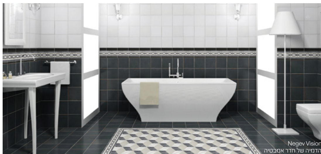
Negev Vision הדמיה של חדר אמבטיה

השקת המערכת בוצעה באמצעות קמפיין טלוויזיה, שהציג את השעשועון "איך יצא השיפוץ", במטרה להעביר את המסר, ש-Negev Vision מאפשרת ללקוח ולמעצב לראות מראש כיצד תראה התוצאה הסופית.