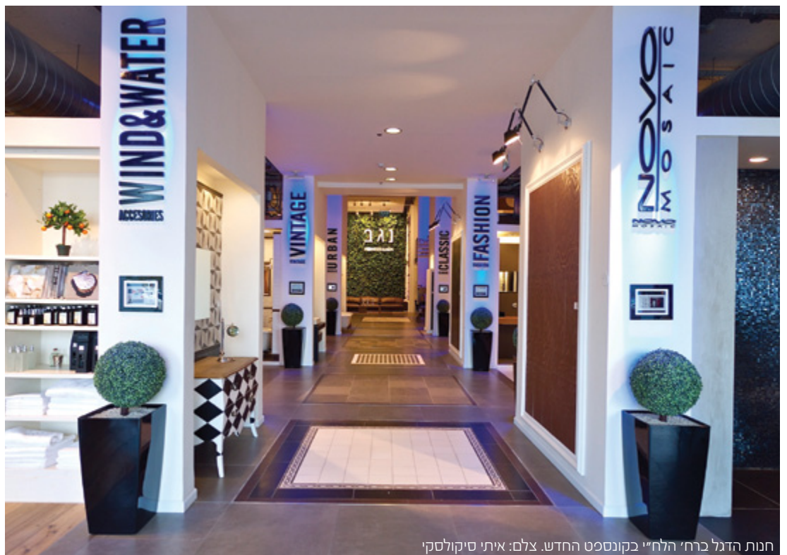
חנות הדגל ברח' הלח"י בקונספט החדש.