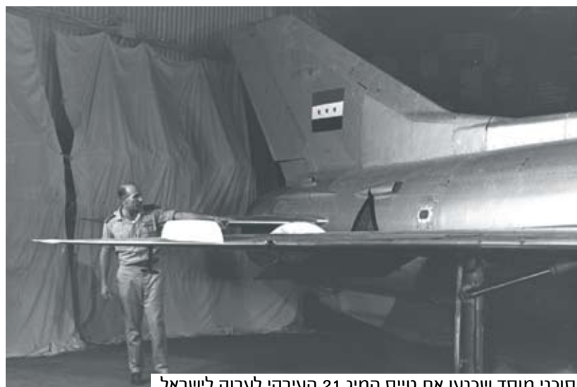
סוכני מוסד שכנעו את טייס המיג 21 העירקי לערוק לישראל