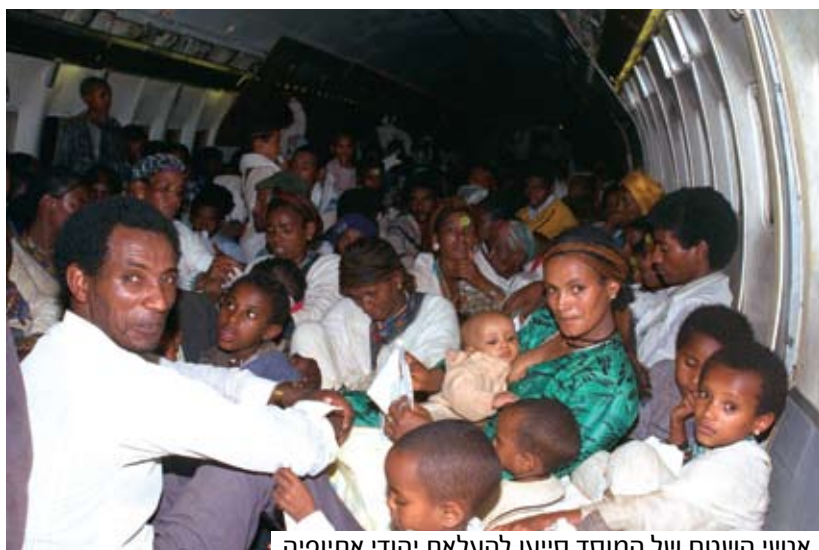
אנשי השטח של המוסד סייעו להעלאת יהודי אתיופיה

באופן טבעי, חשאיות וסודיות אוכפים את פעולתו של המוסד, כמו גם של ארגוני בין אחרים. אולם, דווקא עמימות זאת תורמת לנכסיות המותג, שהופך למקור לספקולציות והוא מוקף הילה מעין רומנטית, המתחזקת בסיועם של סרטים בנושא ריגול, ספרים וידיעות בעיתונות. מכיוון שמאז שנות ה-60 של המאה הקודמת ועד היום מקפיד המוסד להימנע מניהול קשר ממוסד עם אמצעי התקשורת, ובכך פועל לשמירת העמימות של הארגון, הדבר מעצים עוד יותר את ההילה האופפת אותו.