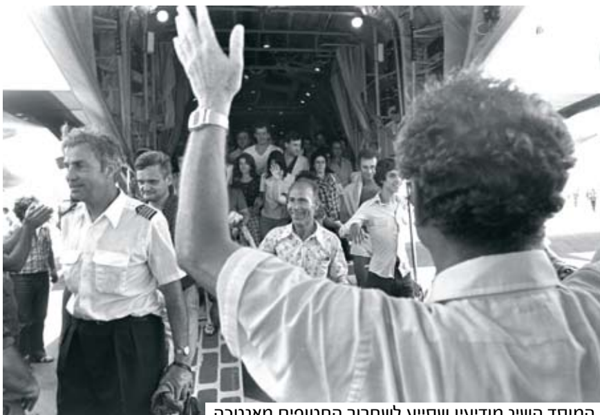
המוסד השיג מודיעין שסייע לשחרור החטופים מאנטבה